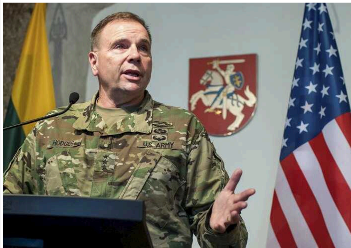
Росія не рахується з людськими втратами на війні, - Годжес

Військово-політичне керівництво РФ знищує у самовбивчих атаках в Україні величезну кількість російських окупантів. Зокрема, багатьох російських загарбників було ліквідовано Силами оборони України за час російського наступу, що розпочався восени, – однак Москва на ці втрати не зважає.