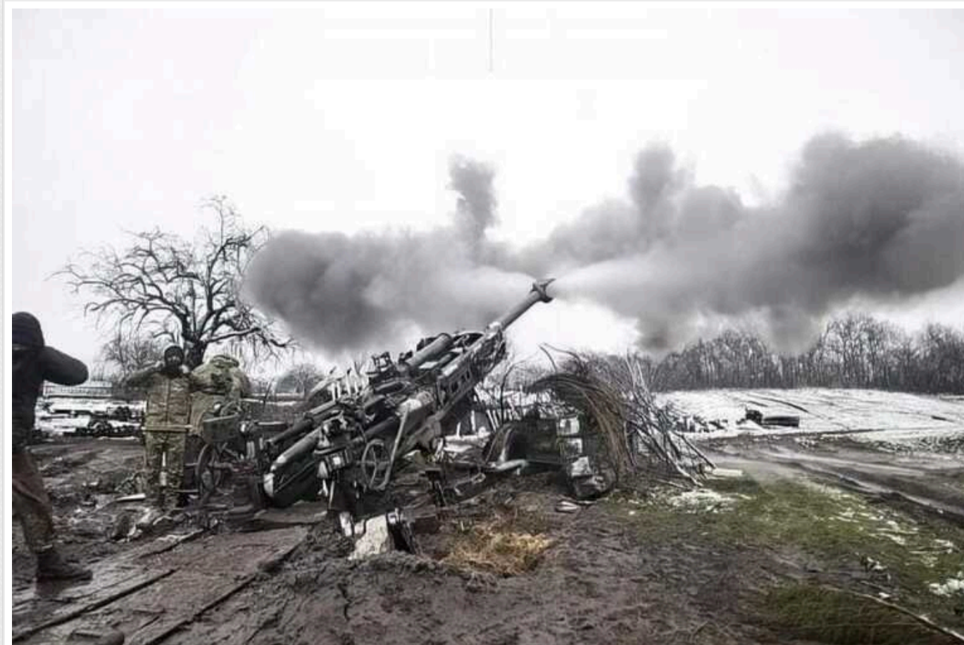
Окупанти вдарили з артилерії по Південному на Донеччині: є загиблі

Російські війська 1 січня 2024 року атакували селище Південне, що на Донеччині. Населений пункт поблизу Торецька загарбники накрыли артилерійським вогнем.