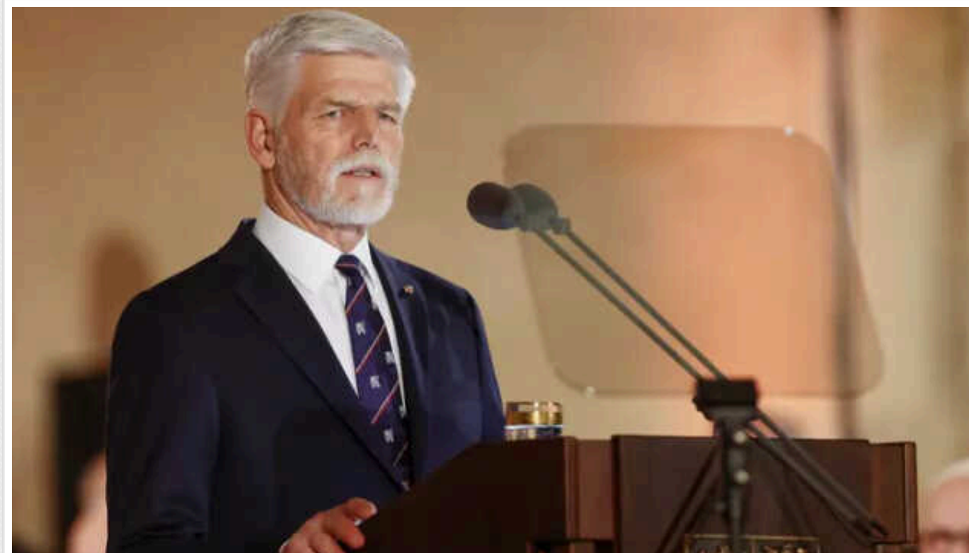
Петр Павел висловився за перехід Чехії на євро

Чехія після 20 років членства в Євросоюзі має довести до кінця перехід на спільну європейську валюту.