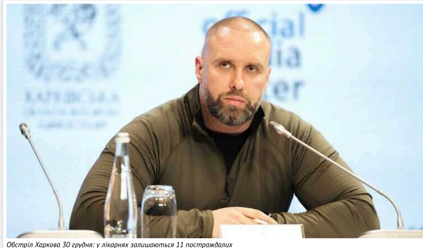
Обстріл Харкова 30 грудня: у лікарнях залишаються 11 постраждалих

11 людей постраждали внаслідок обстрілу, який стався 30 грудня у медичних закладах Харківської області.