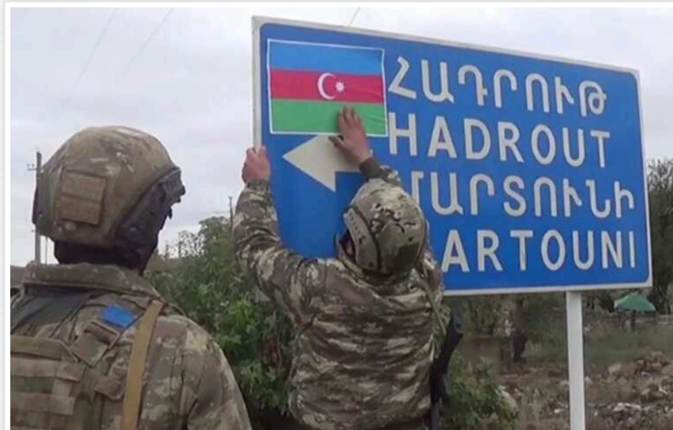
Невизнана Нагірно-Карабаська республіка припинила своє існування

Невизнана Нагірно-Карабаська республіка офіційно припинила своє існування з 1 січня 2024 року.