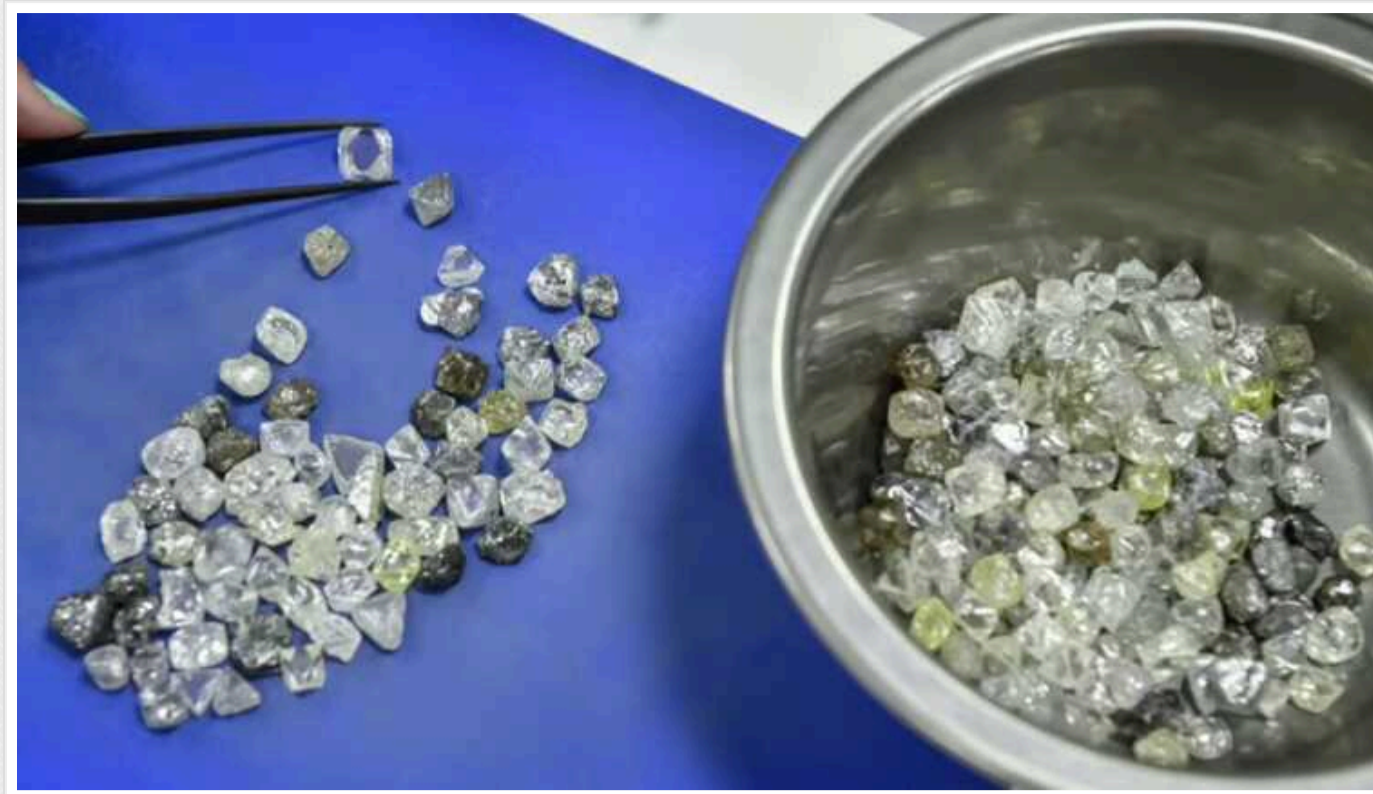
Заборона на імпорт алмазів з РФ до Євросоюзу почала діяти

З понеділка, 1 січня, набула чинності заборона на торгівлю алмазами, що походять з РФ, відповідне рішення щодо російських алмазів було ухвалене в межах 12-го пакету санкцій проти РФ.