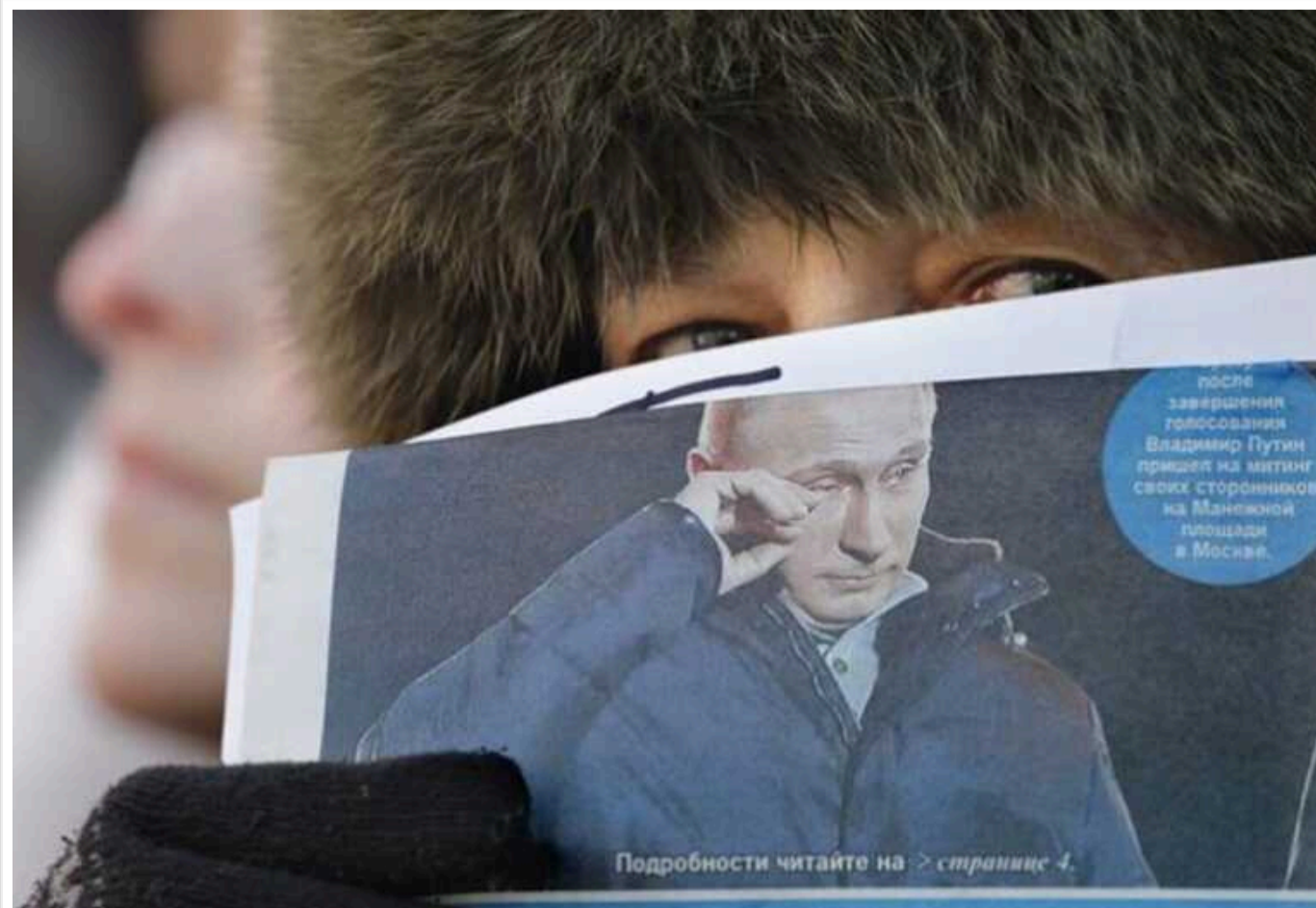
Пропаганда Кремля після нападу на Україну активно нагнітає ситуацію у газетах країн Євросоюзу

Дослідження литовських та українських дослідників показало, що Кремль намагається "підтримувати" ритми і настрої російськомовної спільноти, яка проживає за межами Росії, або тих, хто ідентифікує себе з нею, і не цурається постійно подавати принаймні певний потік інформації через пресу, що видається в Європейському Союзі, а також нагнітати напруженість.