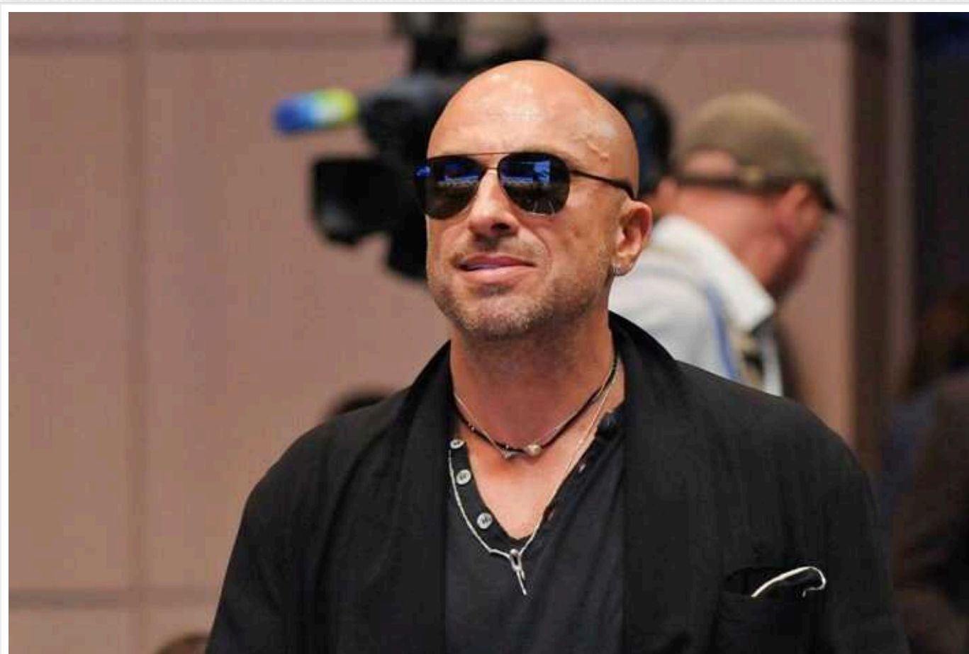
Дмитро Нагієв викликав істеріку в росіян через загадкове привітання з Новим роком: українці дякують ведучому за підтримку

Російський актор Дмитро Нагієв, який іноді делікатно натякає на свою незгоду з політикою Кремля, але все ж уникає прямого засудження війни, обурив росіян привітанням з Новим роком. Українці, навпаки, йому подякували.