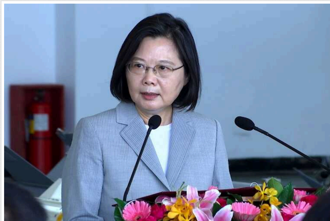
Президент Тайваню Цай Інвень відповіла на погрози Сі Цзіньпіна

Відносини Тайваню з Китаєм повинні визначатися волею народу, а світ має ґрунтуватися на "гідності".