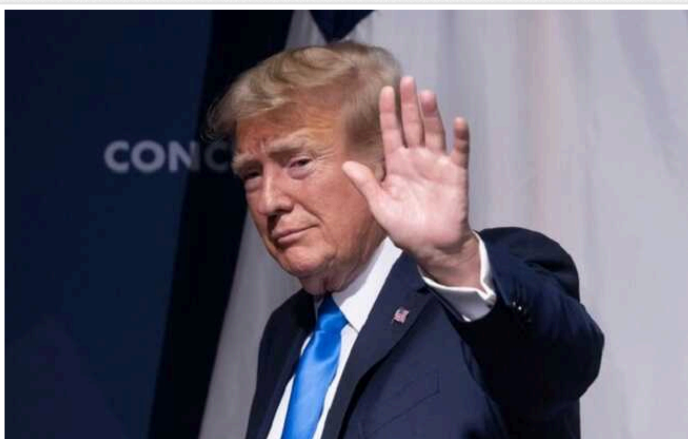
Українці "почуваються покинутими": в Європі готуються до президентства Трампа, – The Times

Європейські країни сподіваються продовжувати надавати Україні зброю ще принаймні рік у випадку, якщо США припинять допомогу. Водночас у британській розвідці не вірять, що 2024 рік принесе перемогу у війні.