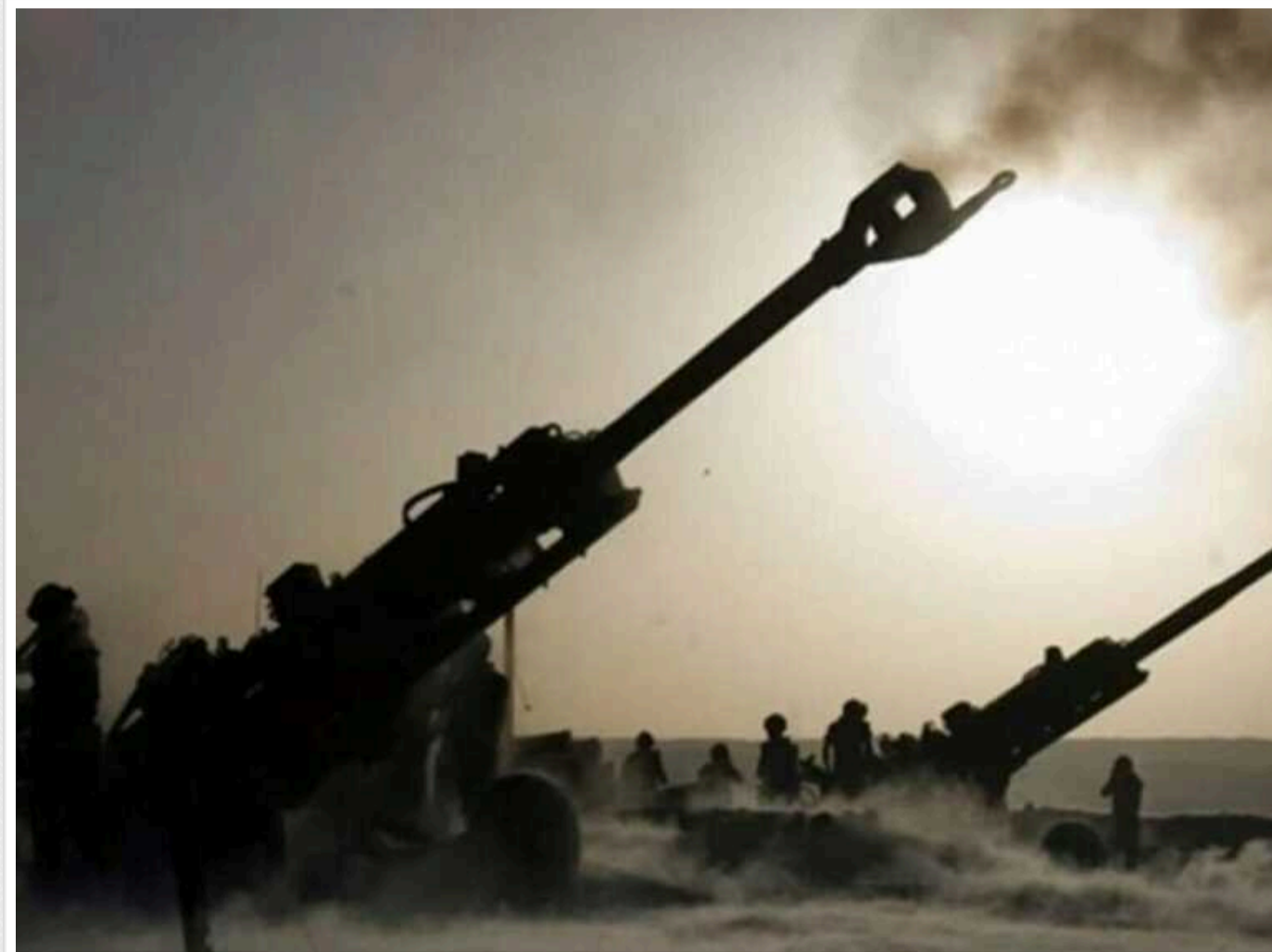
Окупанти обстріляли житловий будинок у Велетенському на Херсонщині: під завалами опинилися двоє людей