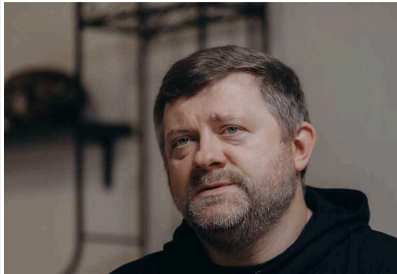
Перший віцепікер Верховної Ради Корнієнко назвав проблемою нездатність України протиставити щось російському серіалу "Слово пацана"

Читати на русском Додати як бажане джерело в Google