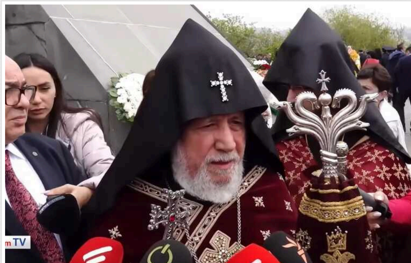
Традиційний новорічний виступ Католікоса Усіх Вірмен цього року вперше не транслювали

Традиційний передноворічний виступ Католікоса Усіх Вірмен Гарегіна Другого цього року транслюватися в ефір не буде.