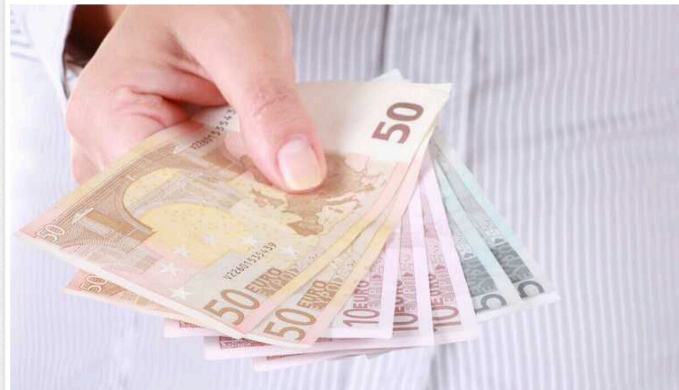
У Німеччині з 1 січня зросте Bürgergeld – щомісячна допомога з безробіття, зокрема для українських біженців

Сума допомоги зростає з 502 до 563 євро (тобто на 12%).