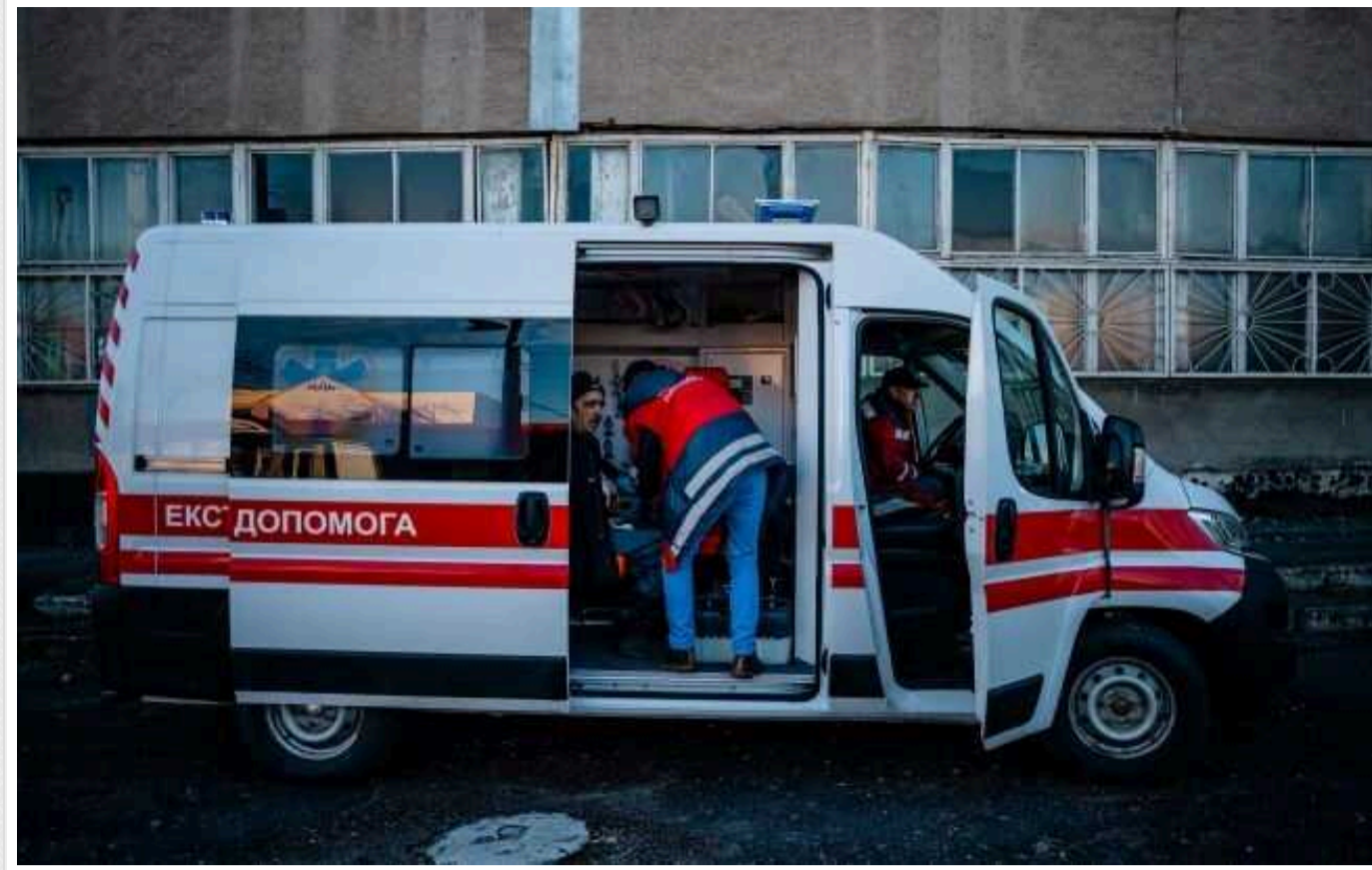
Обстріл Херсона: кількість поранених за добу зросла до 14

Кількість поранених через вчорашні обстріли Херсона зросла до 14 осіб, серед них дитина. Також окупанти позбавили життя 11-річного хлопчика.