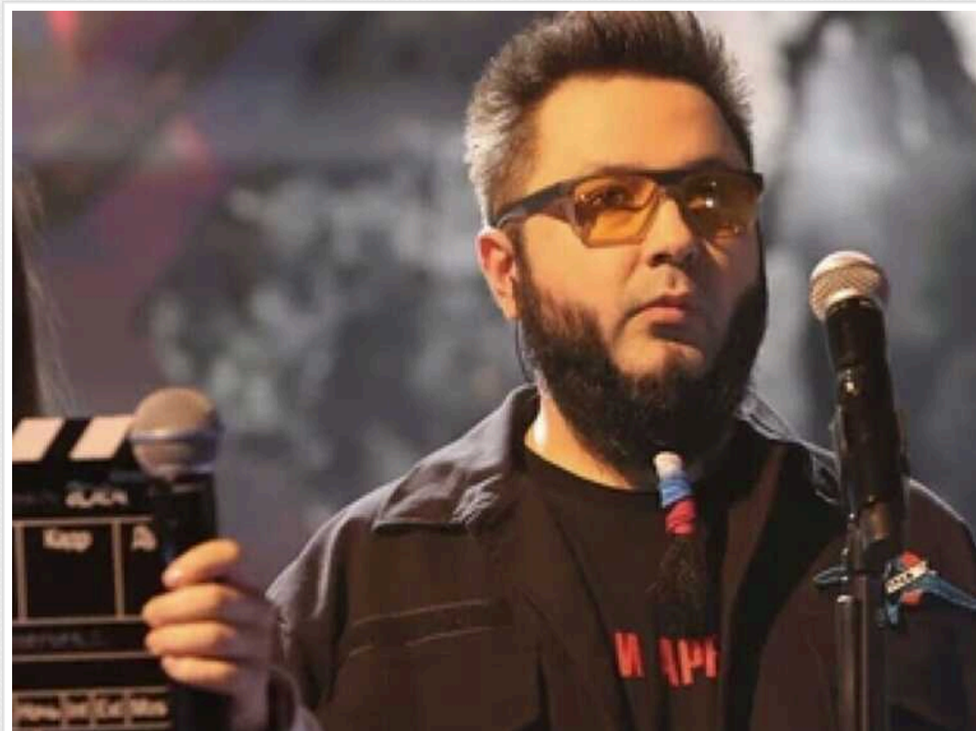
На пропагандистському Першому каналі цинічно заспівали "Пливе кача", коли в Одесі горіла багатоповверхівка, а українці ховалися від БПЛА

У новорічну ніч, коли в Одесі палав багатоквартирний будинок унаслідок влучання російського безпілотника, на провладному Першому каналі у Росії лунала пісня "Пливе кача", яку на свій лад переспівав репер з нині окупованого Маріуполя Акім Апачев. У ній путініст українською мовою оспівав тероризм РФ та назвав українських воїнів "демонами".