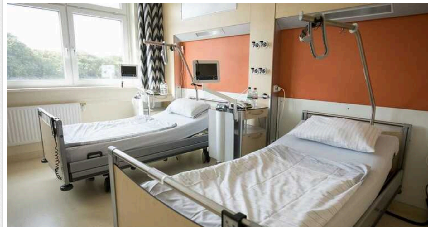
На Хмельниччині внаслідок атаки дронів постраждала дитина: вона перебуває в реанімаційному відділенні лікарні

Російські окупаційні війська під час масованої дронавої атаки по Україні, яка тривала ввечері перед Новим роком, 31 грудня, спрямували шість "шахедів" на Хмельниччину. Сили ППО збили їх усі, але внаслідок цих подій травмувалася неповнолітня дитина.