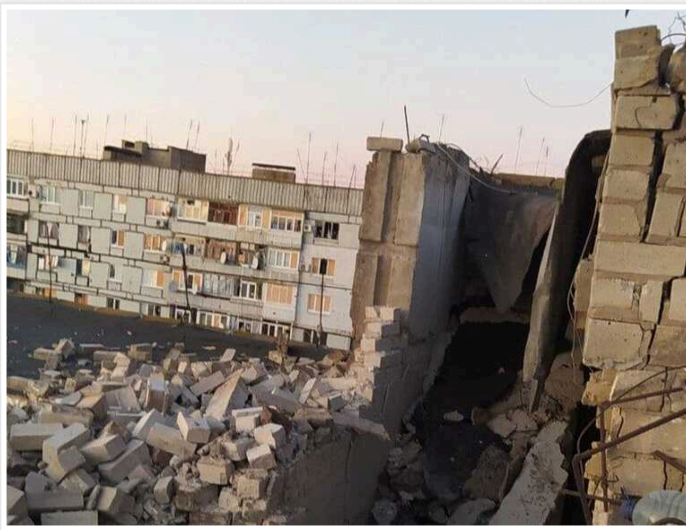
Минулої доби війська РФ завдали 159 ударів по 25 населених пунктах Запоріжжя, поранено чотири людини

Упродовж минулої доби російські окупанти завдали 159 ударів по 25 містах та селах Запорізької області.