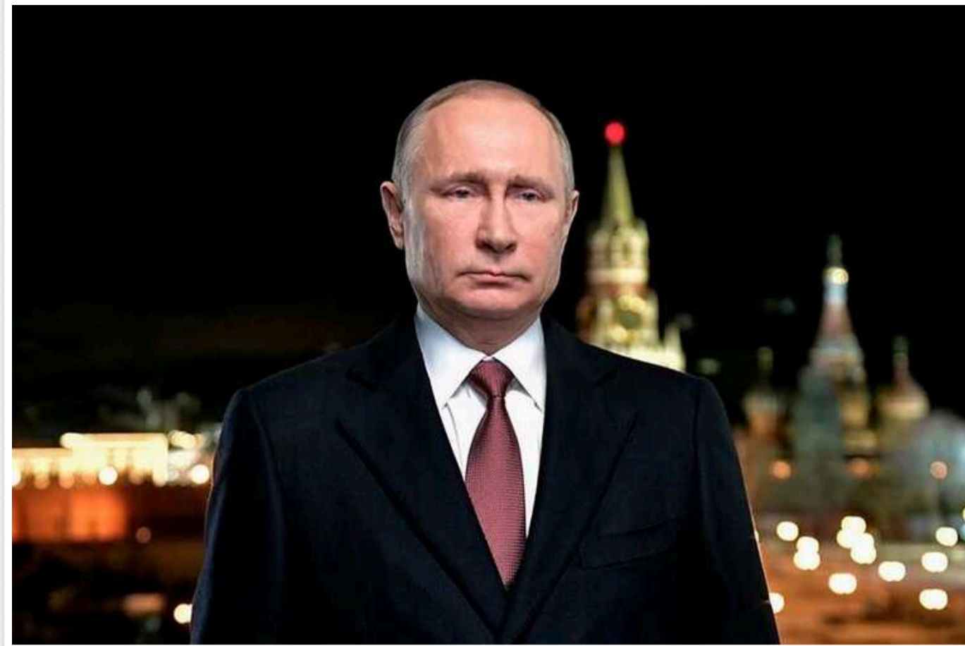
У Кремля особлива мета: в ISW пояснили, чому Путін у новорічному зверненні лише побіжно згадав війну проти України

Глава держави-агресора Росії Володимир Путін використав своє щорічне новорічне звернення 31 грудня, щоб конкретизувати російські ідеологічні пріоритети на 2024 рік. Він опустив будь-які згадки про війну проти України, але зосередився на визначенні ідеологічних цілей, які, в підсумку, все одно впливатимуть на бойові дії та ситуацію на окупованих територіях.