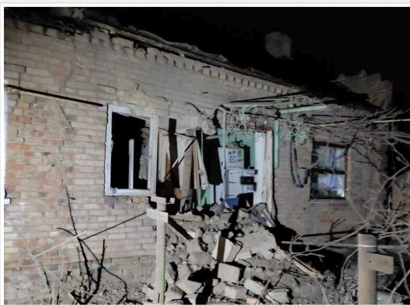
Вночі окупанти атакували Дніпропетровщину: влучили у підприємство, пошкоджено ЛЕП

Вночі 1 січня окупанти атакували Дніпропетровську область дронами-камікадзе, обстріляли Нікопольщину з артилерії.