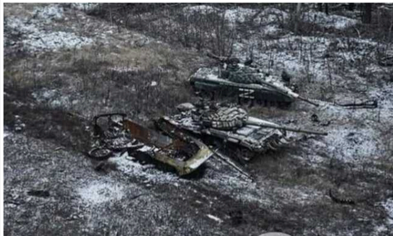
За добу ліквідовано 780 окупантів та 17 ББМ: РФ за час війни втратила в Україні 360 тисяч військових

Сили оборони України за останню добу 2023 року ліквідували на фронті 780 військовослужбовців армії Росії. Також її позбавили 156 одиниць озброєння та техніки.