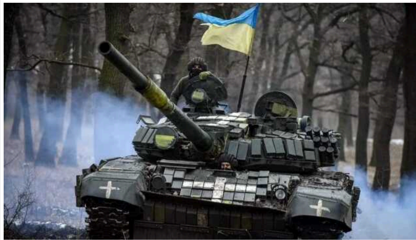
Українські захисники за добу відбили атаки ворога на 7 напрямках, – Генштаб

Протягом минулої доби відбулося 55 бойових зіткнень. Ворог безуспішно 13 разів атакував позиції ЗСУ на лівобережжі Херсонщини.