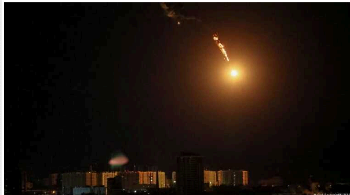
РФ у новорічну ніч запустила по Україні 90 "Шахедів" і 8 ракет: Сили ППО у новорічну ніч збили 87 ворожих дронів

Російські терористи у новорічну ніч атакували Україну 90 дронами-камікадзе Shahed та вісьмома ракетами. Силам протиповітряної оборони вдалося знищити 87 ворожих безпілотників.