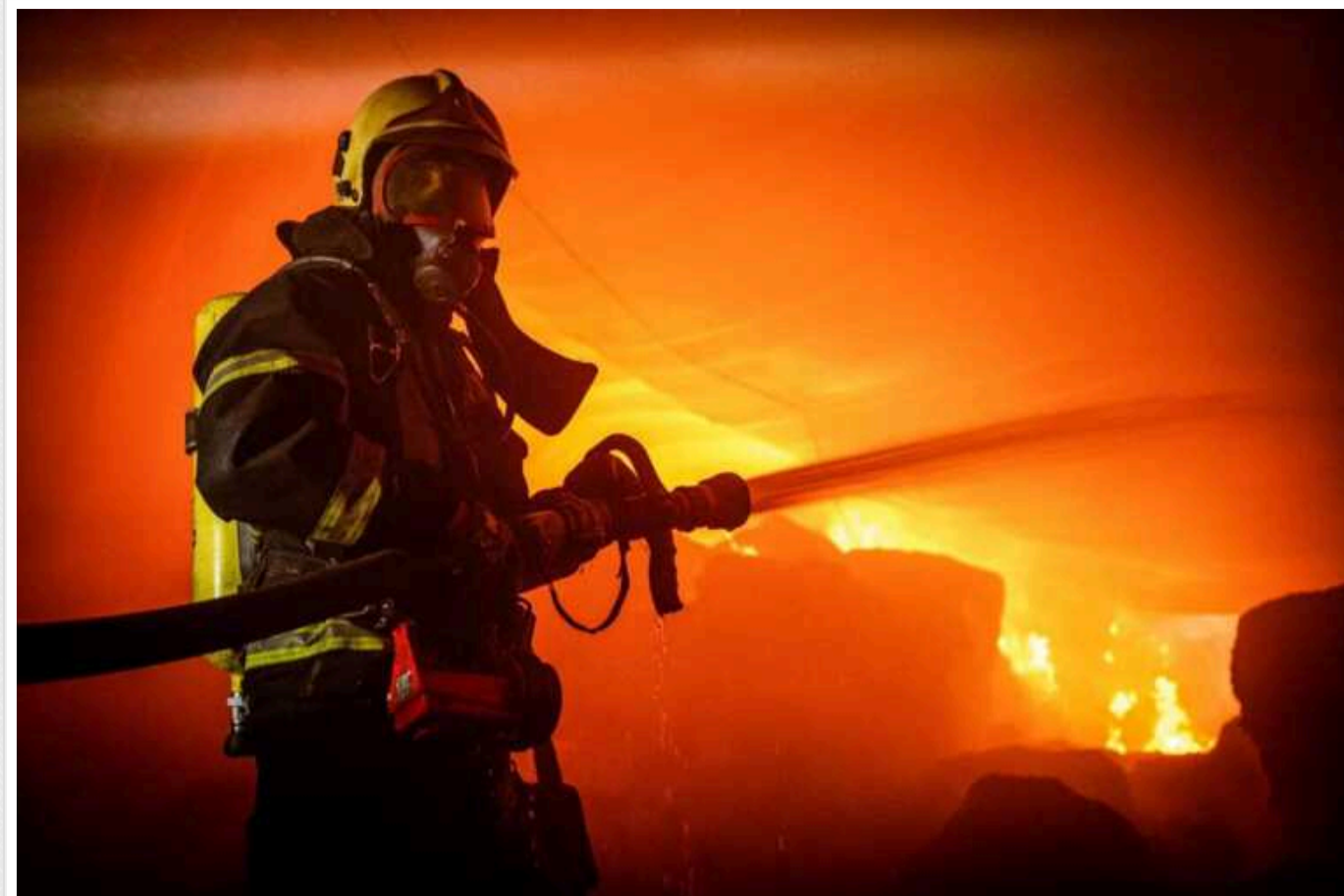
Виникла пожежа: окупанти вночі вдарили по портовій інфраструктурі в Одеській області

Ворог вночі вдарив по портовій інфраструктурі в Одеській області.