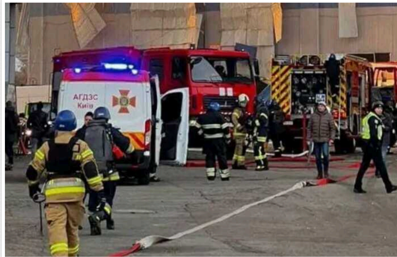
Атака РФ 29 грудня: у Києві рятувальники виявили тіла ще чотирьох загиблих

У Києві рятувальники виявили тіла ще чотирьох загиблих під час масованої атаки окупантів 29 грудня.