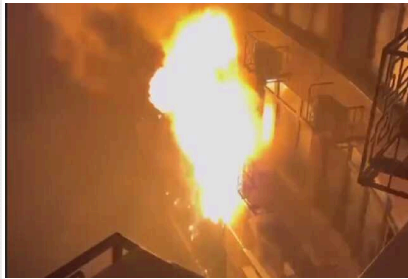
В Одесі внаслідок влучання «шахеда» в одному з ЖК виникла серйозна пожежа

В Одесі приліт "шахеда" по житловому будинку.