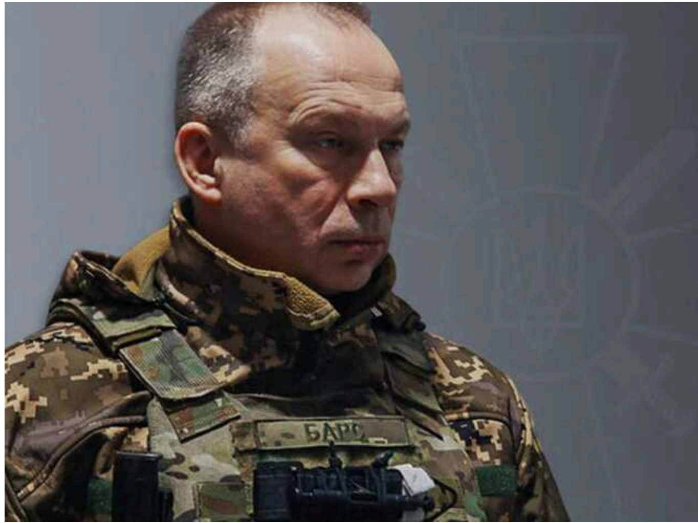
"Щоб прийдешній рік став переможним для України": Сирський привітав військових із Новим роком

Командувач Сухопутними військами ЗСУ генерал-полковник Олександр Сирський привітав українських воїнів з Новим роком.