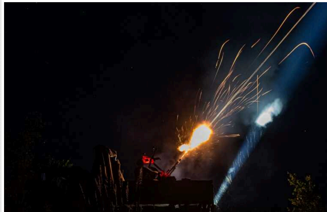
Атака "шахедів": у Миколаївській області повідомляють про "прильоти"

Російські війська атакували територію України дронами-камікадзе. На Миколаївщині після атаки повідомляють про "прильоти".