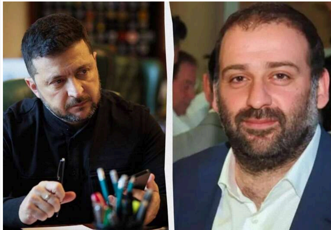
"Міндічгейт" та підозра Єрмаку можуть заблокувати вступ України до ЄС, – Die Zeit

Автори матеріалу «Атака зсередини» розповіли про операцію «Мідас», назвавши її, мабуть, найражачим випадком корупції, який країна бачила за останні роки, - Die Zeit.