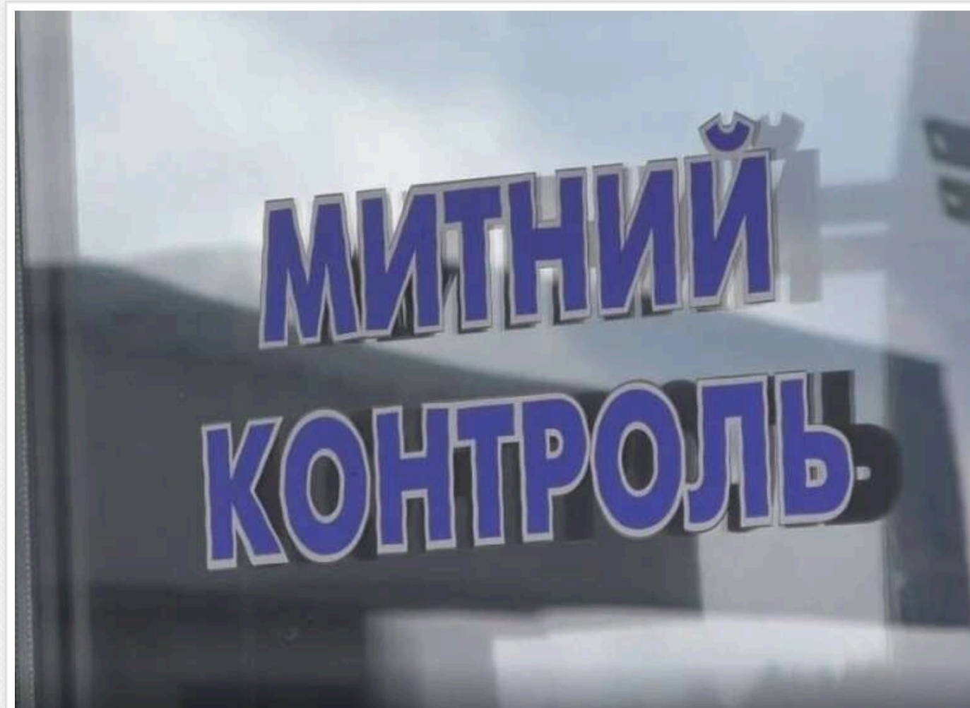
Митниця переходить на повну автоматизацію: Держмитслужба запускає форматно-логічний контроль декларацій

Станом на травень 2026 року цифрова трансформація Державної митної служби України виходить на новий етап, пов'язаний із практичним запуском форматно-логічного контролю (ФЛК) як одного з ключових інструментів автоматизації митного адміністрування.