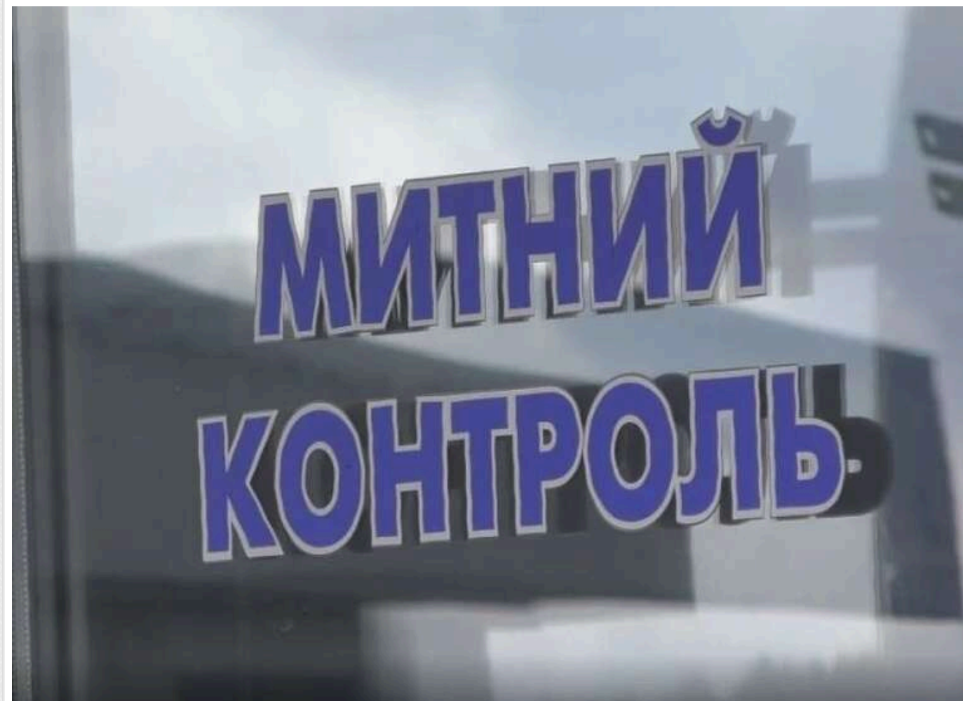
Митниця переходить на повну автоматизацію: Держмитслужба запускає форматно-логічний контроль декларацій

Станом на травень 2026 року цифрова трансформація Державної митної служби України виходить на новий етап, пов'язаний із практичним запуском форматно-логічного контролю (ФЛК) як одного з ключових інструментів автоматизації митного адміністрування.