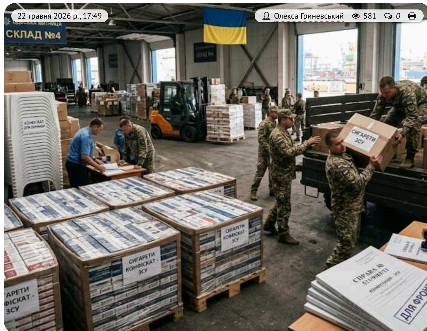
Сигарети – на фронт, столи – державі: Одеська митниця через 5 років домоглася конфіскації у мільйонній справі

Хаджибейський районний суд міста Одеси поновив строки виконання постанови про конфіскацію майна у справі іноземця, який намагався ошукати українську митницю ще у 2021 році. Окрім вилучення товару, сума штрафу для правопорушника перевищує 10 мільйонів гривень.