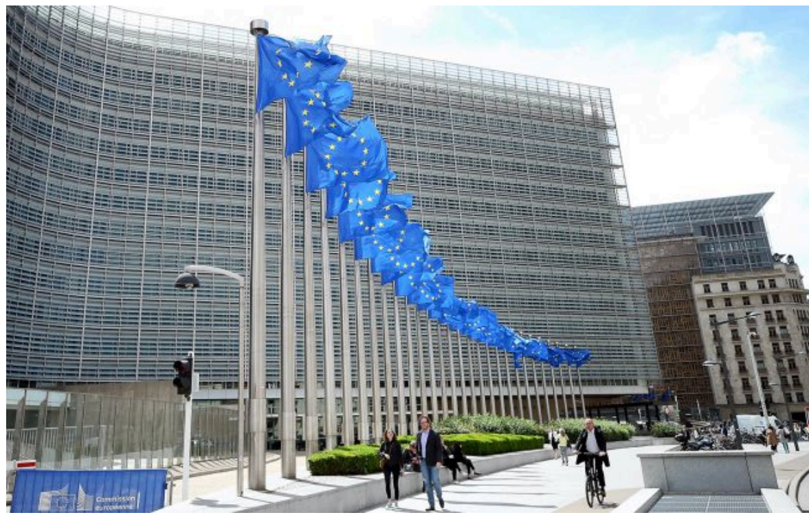
Фото: ЄС відклали санкції на 9 місяців (Getty Images)