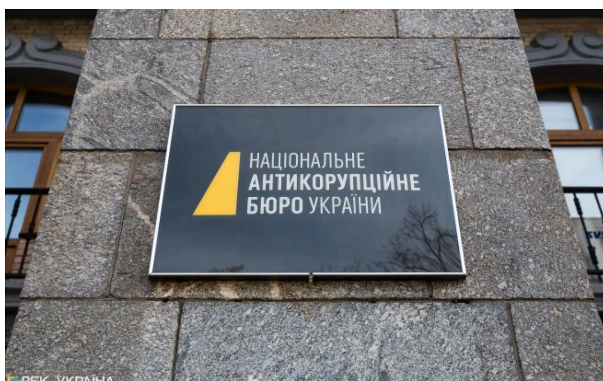
Фото: НАБУ викрило корупційну схему в Держрезерві (Getty Images)

Не витрачай час на шум! Читай тільки суть з РБК-Україна у Google