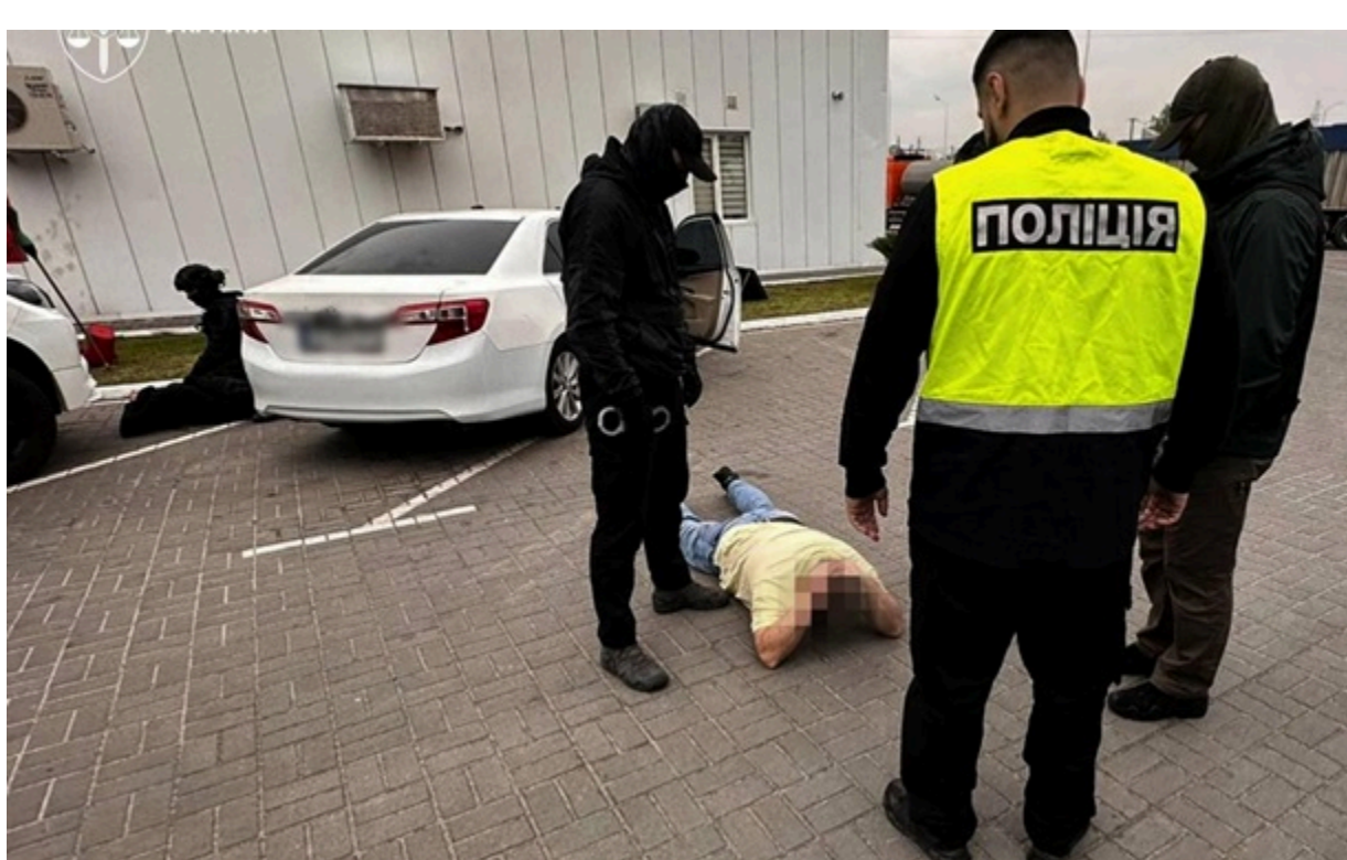
Длині вимагали $18-20 тисяч за вигадану інвалідність і виїзд за кордон

Медики організували схему оформлення підроблених діагнозів і груп інвалідності за $18-20 тисяч.