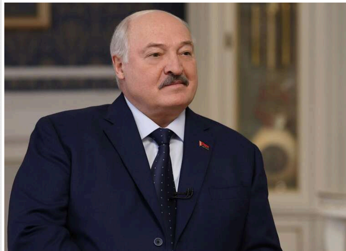
Лукашенко назвав заяви Зеленського про загрозу вторгнення з Білорусі "порожньою балаканиною"

Лукашенко назвав заяви Зеленського щодо загрози вторгнення з Білорусі «порожньою балаканиною».