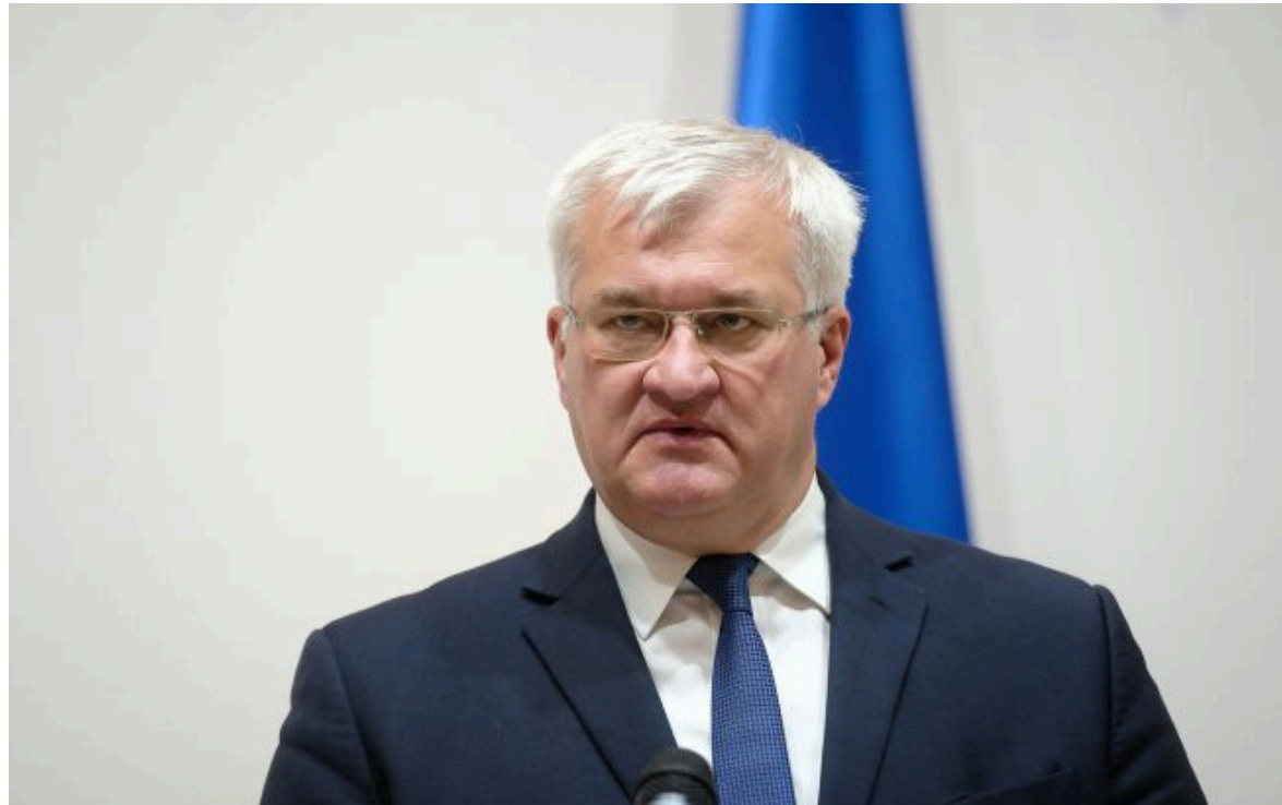
Фото: Андрій Сибіга (Віталій Носач, РБК-Україна)