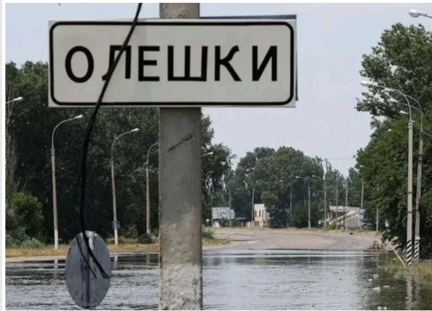
Україна запропонувала РФ локальне перемир'я для евакуації 6 тисяч людей з окупованих Олешок, – Лубінець

Україна запропонувала Росії ввести локальне припинення вогню, щоб вивести мирних жителів з Олешок в окупованій частині Херсонської області, де складається критична гуманітарна ситуація.