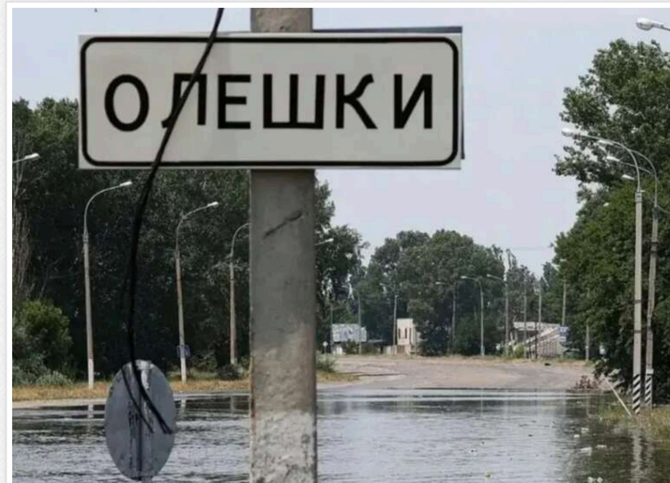
Україна запропонувала РФ локальне перемир'я для евакуації 6 тисяч людей з окупованих Олешок, – Лубінець

Україна запропонувала Росії ввезти локальне припинення вогню, щоб вивезти мирних жителів з Олешок в окупованій частині Херсонської області, де складається критична гуманітарна ситуація.