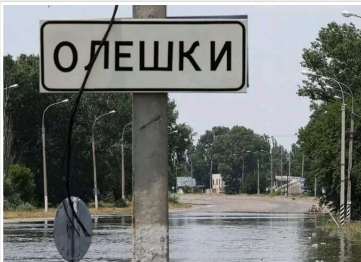
Україна запропонувала РФ локальне перемир'я для евакуації 6 тисяч людей з окупованих Олешок, – Лубінець

Україна запропонувала Росії вести локальне припинення вогню, щоб вивести мирних жителів з Олешок в окупованій частині Херсонської області, де складається критична гуманітарна ситуація.