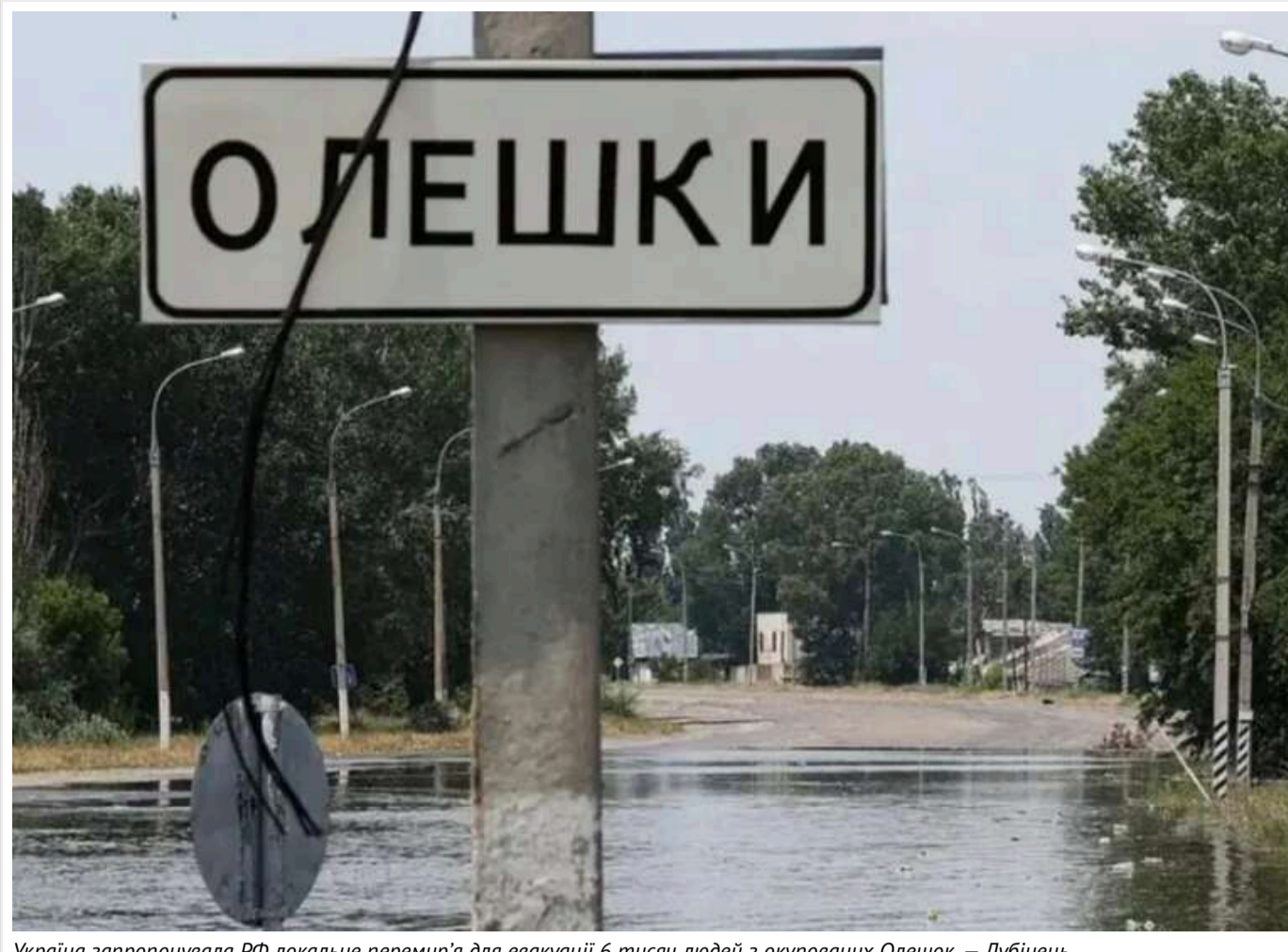
Україна запропонувала РФ локальне перемир'я для евакуації 6 тисяч людей з окупованих Олешок, – Лубинець

Україна запропонувала Росії вести локальне припинення вогню, щоб вивести мирних жителів з Олешок в окупованій частині Херсонської області, де складається критична гуманітарна ситуація.