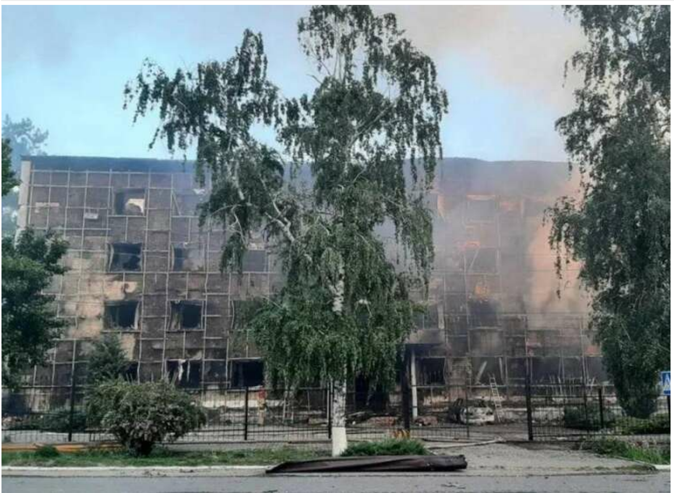
Уражено базу загарбників: Сили оборони завдали удару по об'єкту РФ в окупованому Старобільську

Уночі 22 травня БпЛА нібито атакували навчальний корпус і гуртожиток професійного коледжу педагогічного університету в окупованому Старобільську.