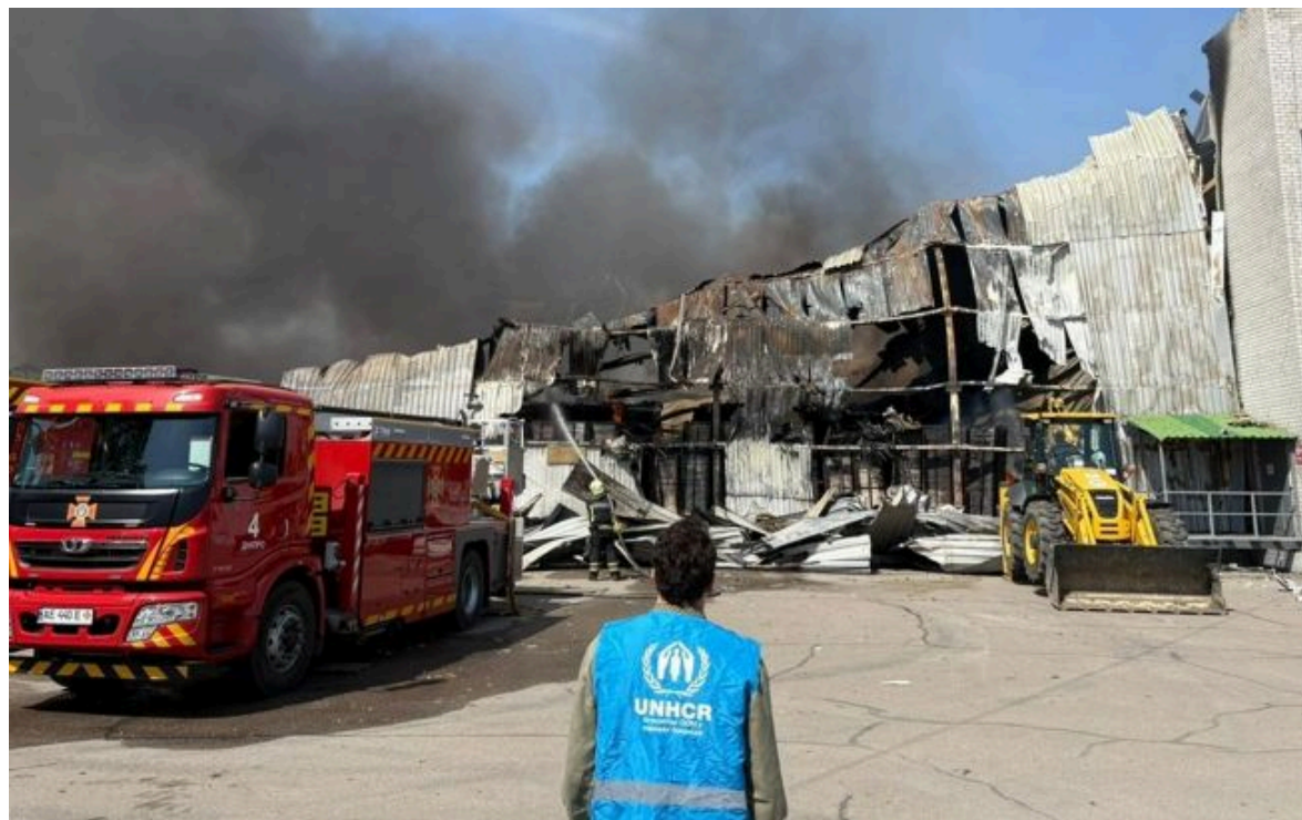
Фото: удар росії по складу гуманітарної допомоги ООН у Дніпрі