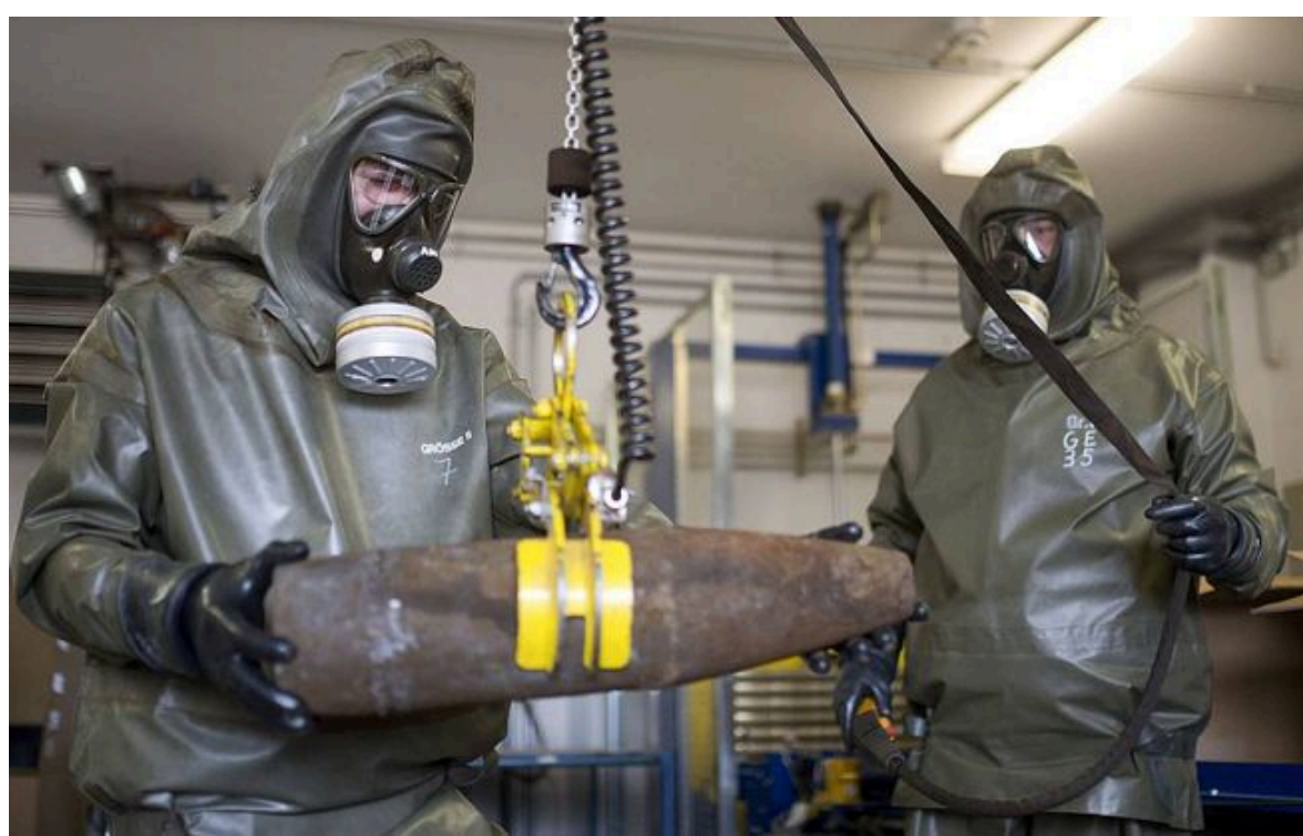
Фото: інтенсивність хімічних атак РФ на фронті стрімко зростає

Розумій ситуацію на фронті через факти, а не чутки з РБК-Україна у Google