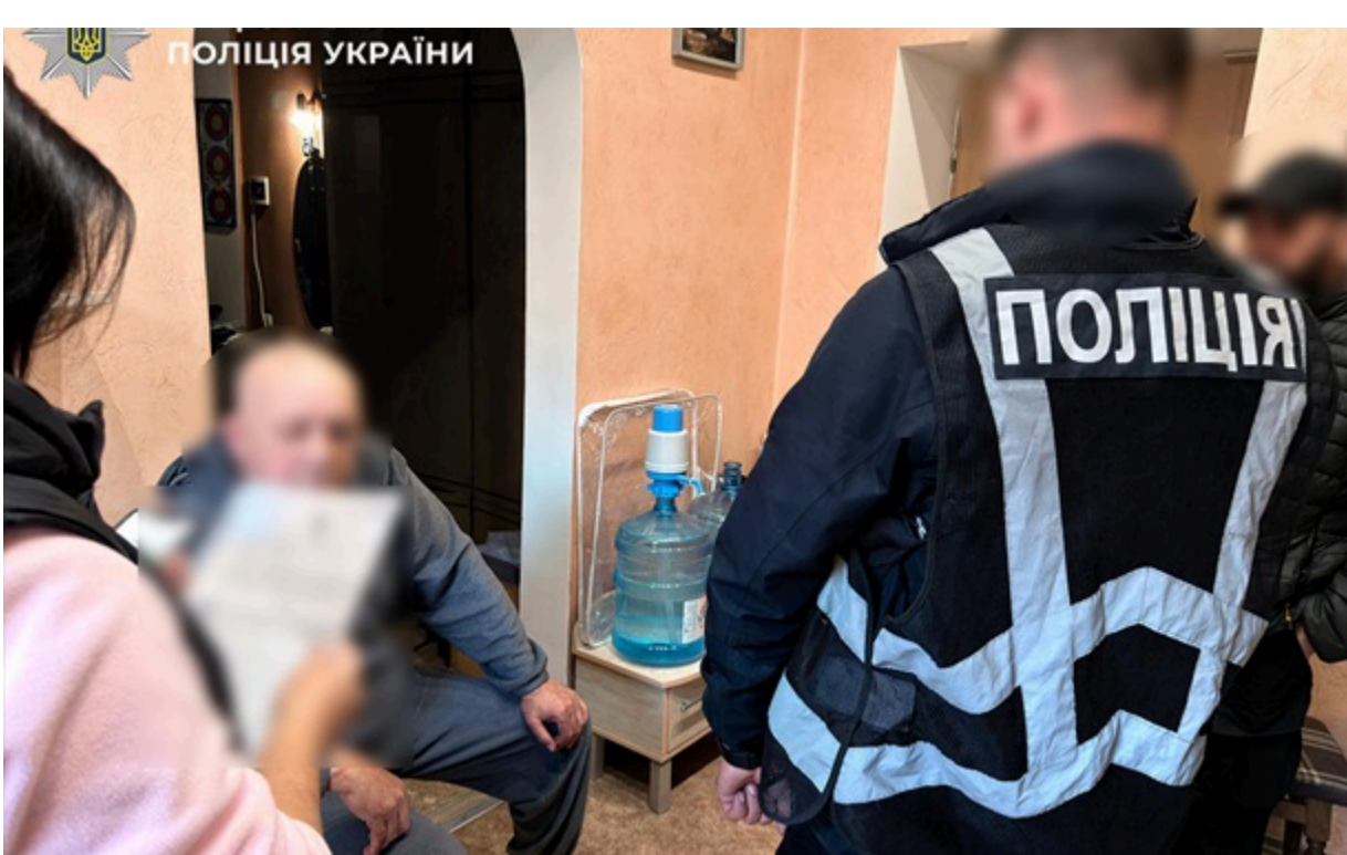
На Львівщині поліція викрила групу шахраїв

Фігуранти входили у довіру до родичів полеглих захисників, отримували доступ до банківських рахунків та намагалися заволодіти виплатами, зокрема одноразовою допомогою 15 мільйонів.