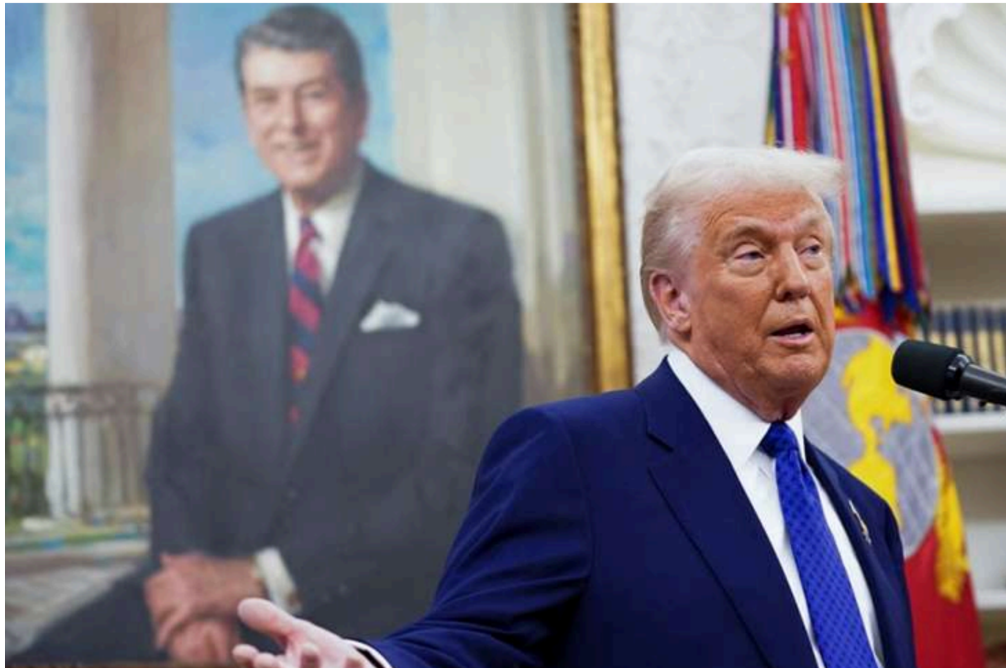
Дональд Трамп

Президент США Дональд Трамп заявив, що Штати - попри попередні заяви Пентагону - відряджають до Польщі додатковий військовий контингент. Про це він написав у своїй соцмережі Truth Social, передає Ukrinform.