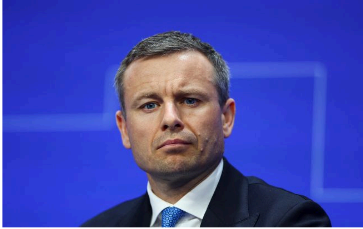
Фото: міністр фінансів України Сергій Марченко (Getty Images)

Не витрачай час на шум! Читай тільки суть з РБК-Україна у Google