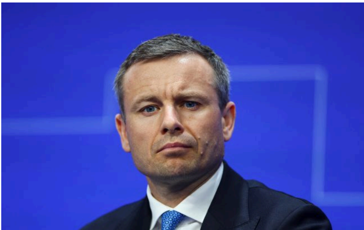
Фото: міністр фінансів України Сергій Марченко