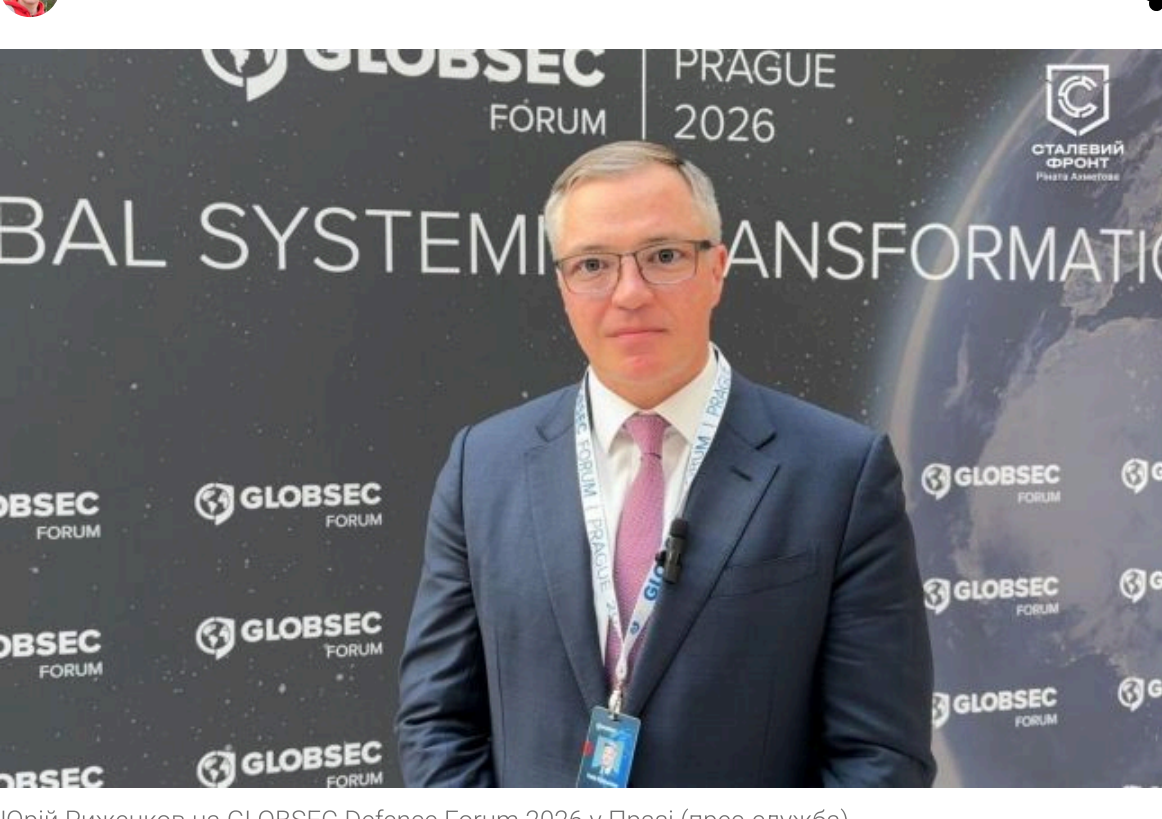
Юрій Риженков на GLOBSEC Defence Forum 2026 у Празі

Не втрачай час на шум! Читай тільки суть з РБК-Україна у Google