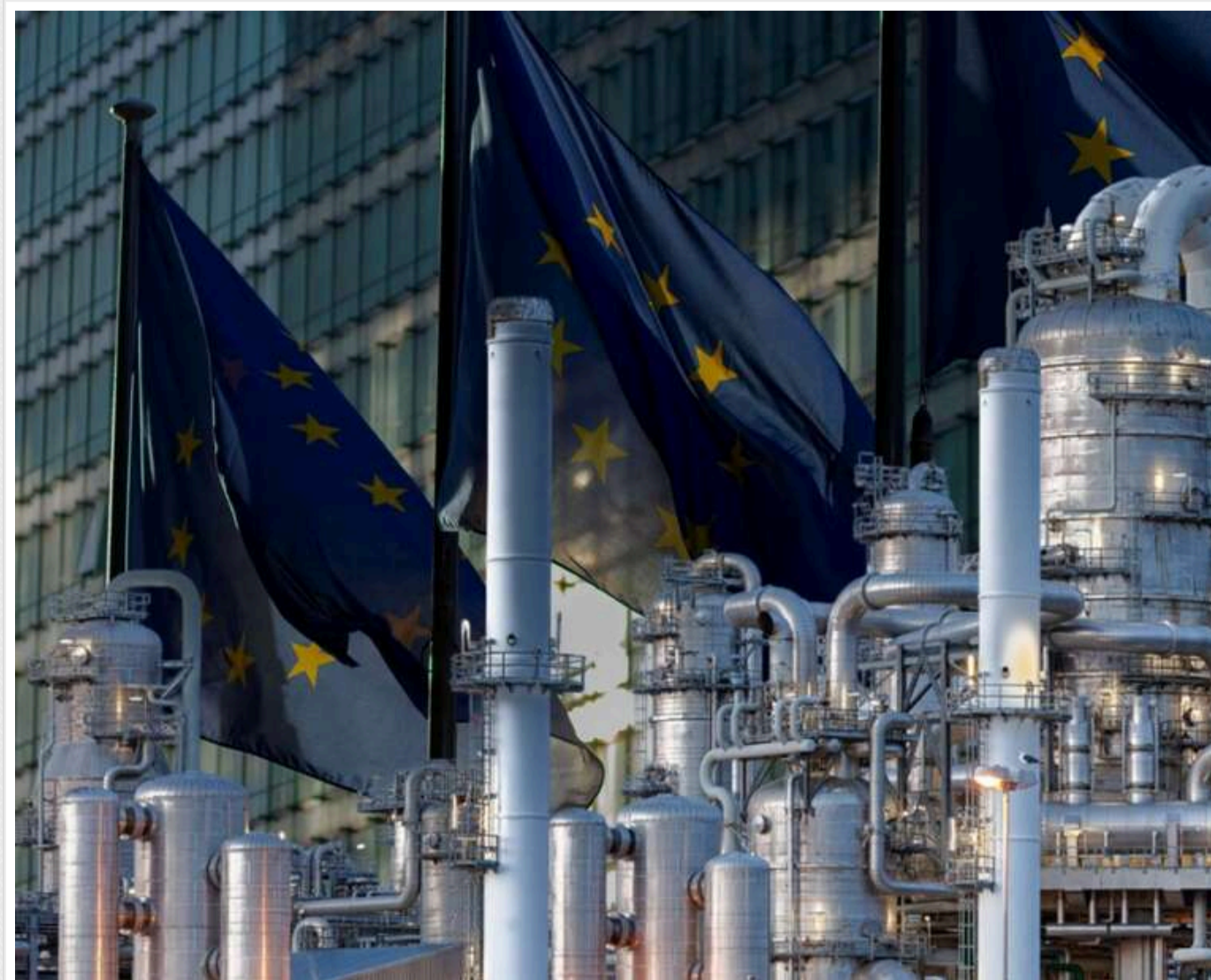
Блокада Ормузької протоки загрожувє Європі паливною кризою: сховища газу заповнені лише на 35%

Якщо Ормузький пролив залишиться закритим ще хоча б місяць, Європа може зіткнутися з гострою нестачею газу, передає Reuters з посиланням на норвезьку компанію Equinor.